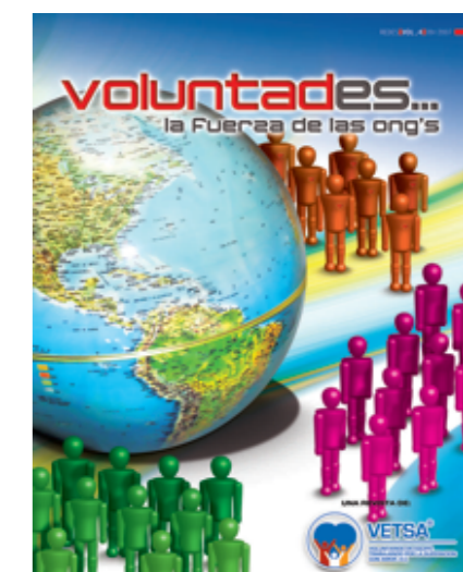
Diseño de portada: Humberto Daniel Niño P.

Voluntades es una publicación con derechos reservados. El contenido de los artículos es responsabilidad exclusiva de los autores. Queda prohibida la reproducción parcial o total del material publicado, sin consentimiento. DERECHO DE AUTOR: 04-2006-053017164600-102